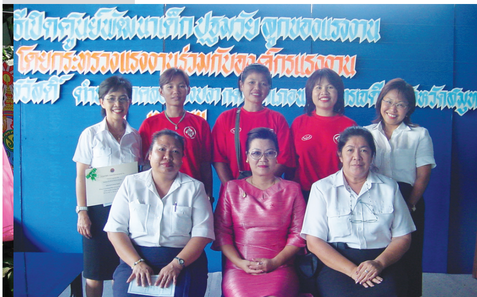
ทีมงานกลุ่มบูรณาการแรงงานสตรี วันเปิดศูนย์พัฒนาเด็กปฐมวัยลูกของแรงงาน ร่วมกับกระทรวงแรงงาน