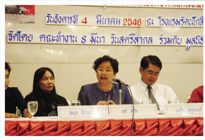
งานสัมมนาและแถลงข่าว วันสตรีสากล ปี ๒๕๔๖