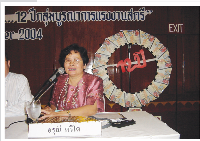
ป่ากุง ในงาน ๑๒ ปี กลุ่มบูรณาการแรงงานสตรี ปี ๒๕๔๗