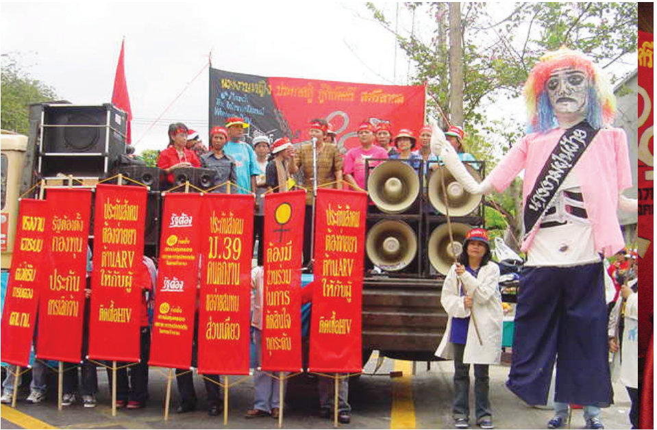
คณงานหญิงร่วมกันรณรงค์เรื่องกฎหมายประกันสังคม ปี ๒๕๓๓