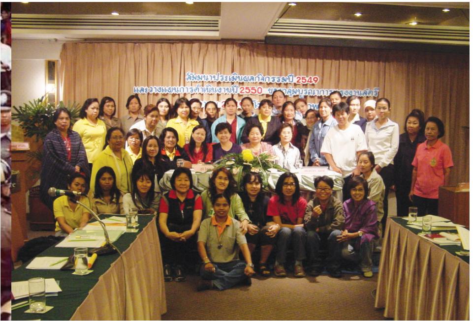
สัมมนาประเมินและวางแผนงานปี ๒๕๕๐ ของกลุ่มบูรณาการแรงงานสตรี (กลุ่มบูฯ ตั้งปี ๒๕๓๕)