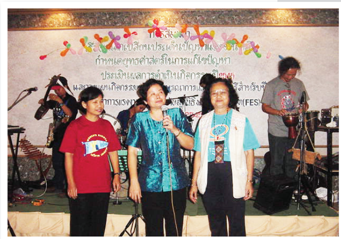
กลุ่มบูรณาการแรงงานสตรี กำหนดยุทธศาสตร์งาน ในวันสตรีสากล ปี ๒๕๔๕