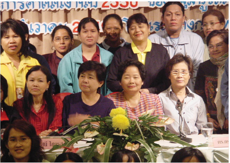
งานสัมมนาในวันสตรีสากลปี ๒๕๕๐ ของกลุ่มบูรณาการแรงงานสตรี