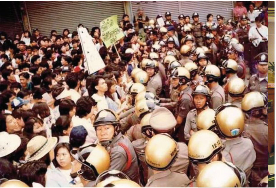
ตำรวจสลายการชุมนุมนัดหยุดงานของคณงานไทยเกรียง ปี ๒๕๒๔