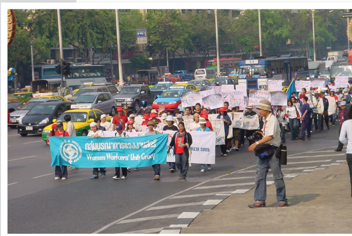
กลุ่มบูรณาการแรงงานสตรี จัดถนรณรงค์วันสตรีสากล ปี ๒๕๔๘