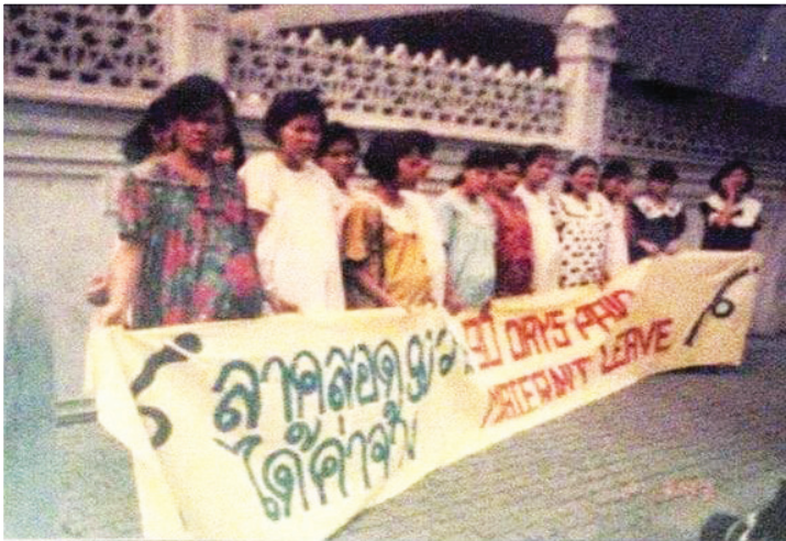
คณงานไทยเกรียงร่วมรณรงค์กฎหมายให้ลาคลอด ๙๐ วัน โดยได้คำจ้าง ปี ๒๕๓๖