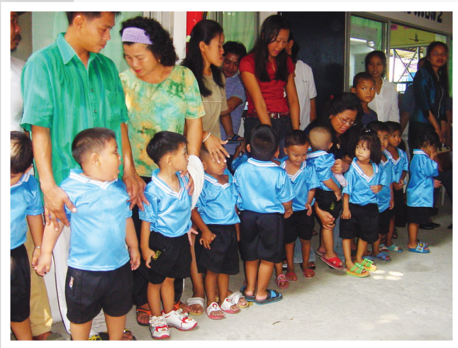
เด็กๆ ในศูนย์พัฒนาเด็กปฐมวัย ลูกของแรงงานที่กลุ่มบูรณาการแรงงานสตรี ร่วมกับองค์กรแรงงาน และกระทรวงแรงงานจัดตั้งขึ้น