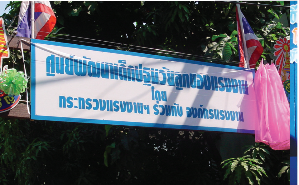
ศูนย์พัฒนาเด็กปฐมวัย ลูกของแรงงานกลุ่มบูรณาการแรงงานสตรี ดำเนินงานเพื่อนำร่องให้สอดคล้องกับการทำงานของพ่อแม่