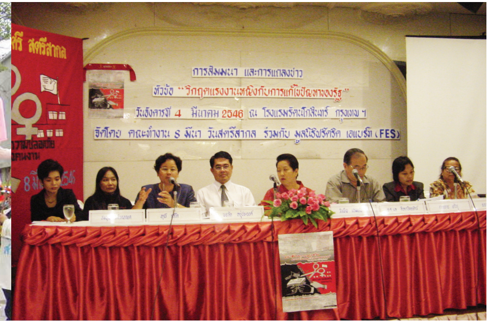
การสัมมนาและแถลงข่าวในวันสตรีสากล ๒๕๔๖ เรื่อง “วิกฤติแรงงานหญิงกับการแก้ไขปัญหารัฐ”